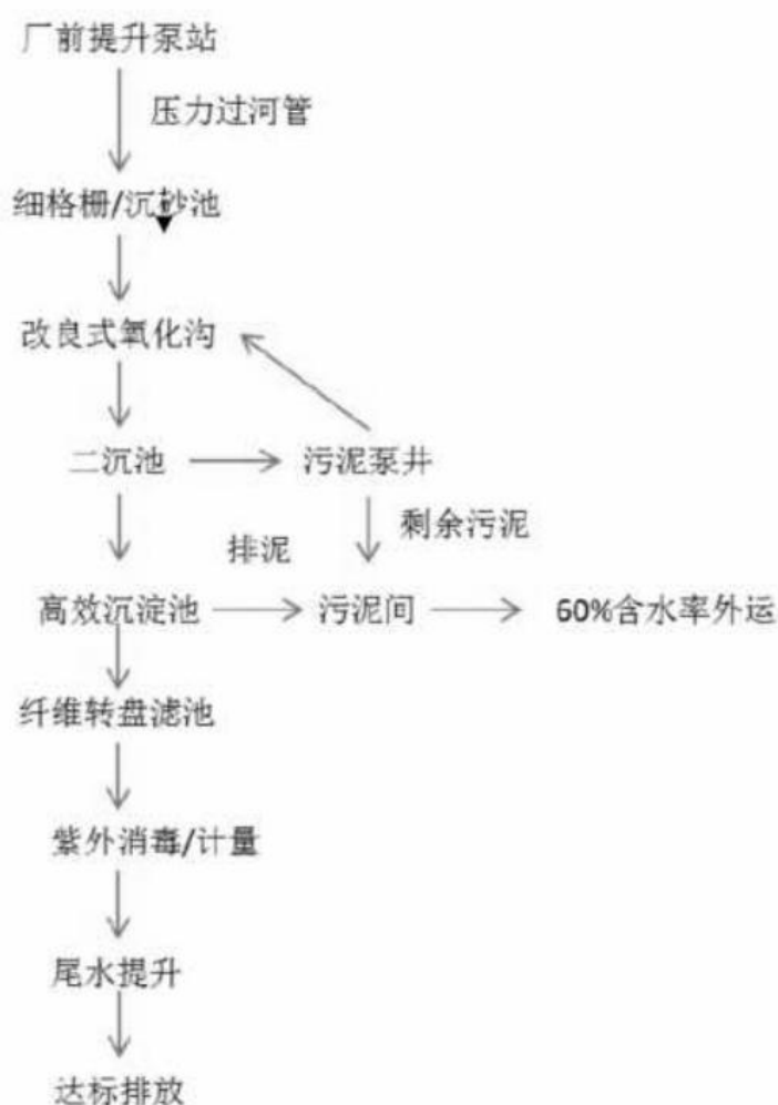
图 4-1 韶关市第三污水处理厂废水处理工艺流程

韶关市第三污水处理厂采用加盖封闭 A/A/O 曝气氧化沟+纤维转盘滤池+紫外消毒工艺。