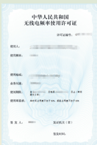
无线电频率许可证样式

就像大家呼吸的空气是人类共有的一样，电磁环境也是人类共有的。只有人人树立依法使用无线电频率、合法设置无线电台（站）的观念，才能保证空中电波秩序的和谐有序，使丰富多彩的无线电应用服务万户千家。营造绿色和谐的电磁环境，离不开我们每个人的努力。