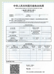
无线电台执照样式