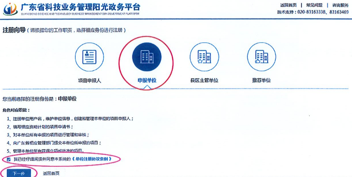
图2 以“申报单位”角色开始注册