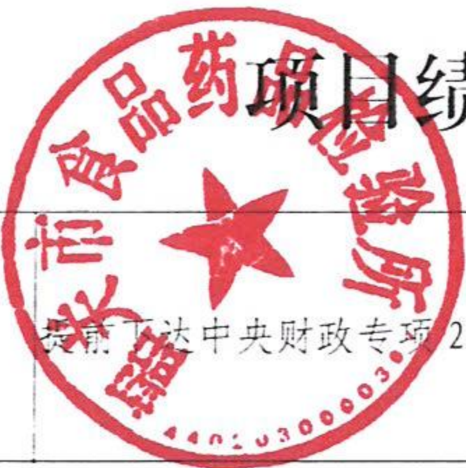
项目绩效目标完成情况表