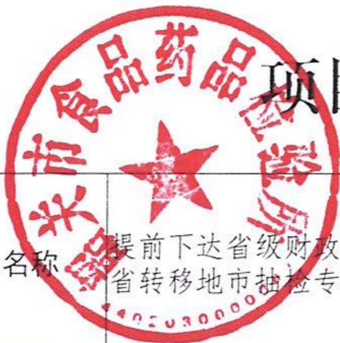
项目绩效目标完成情况表