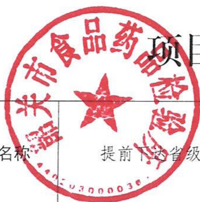
项目绩效目标完成情况表