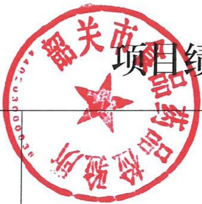
项目绩效目标完成情况表