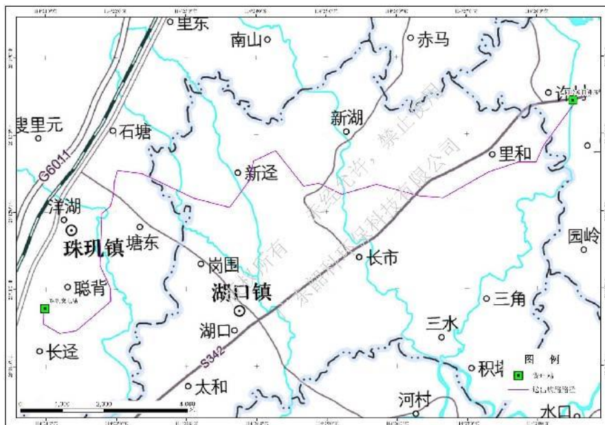
附图 1 项目所在位置示意图