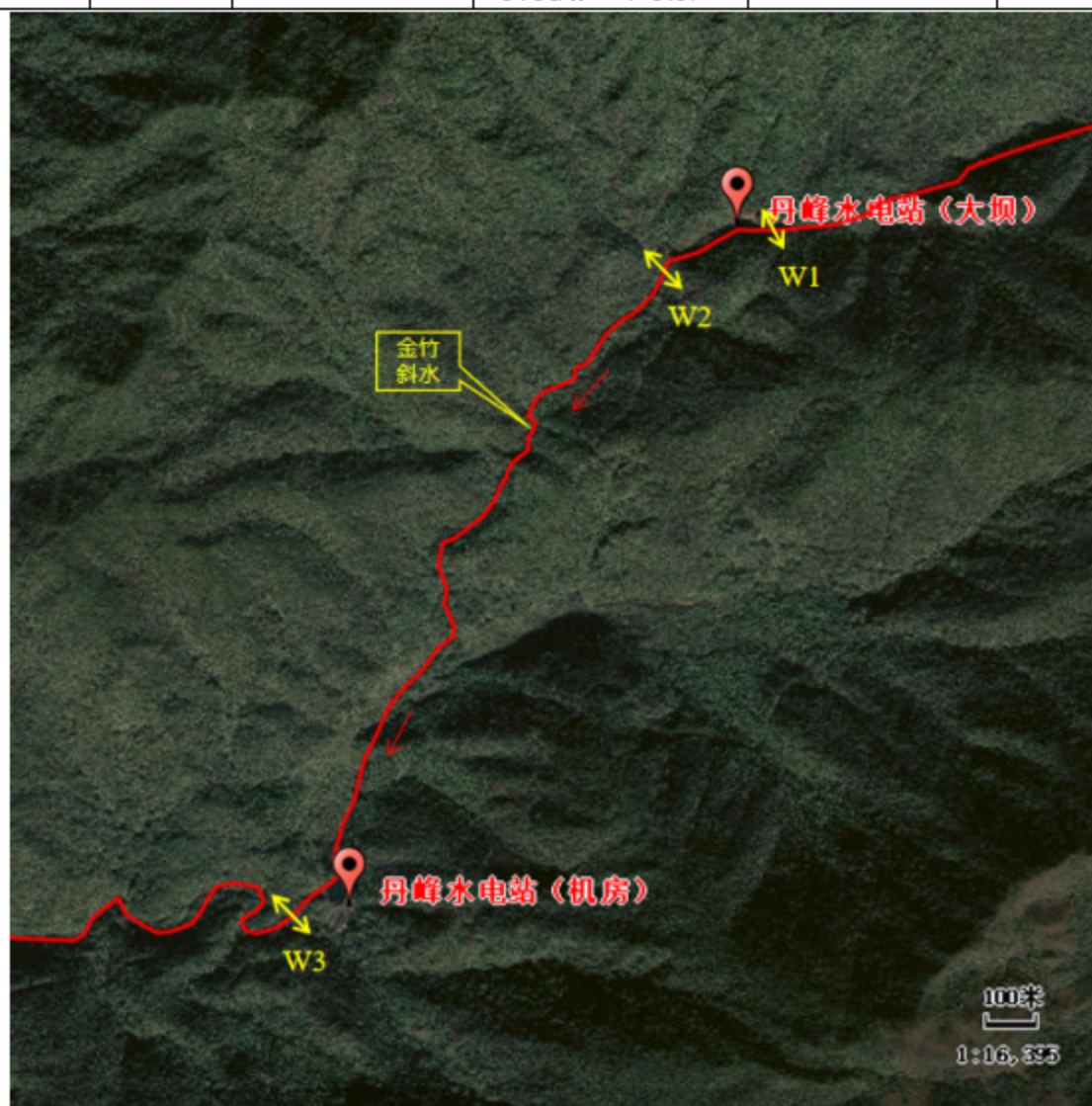
图2 地表水现状监测点位图