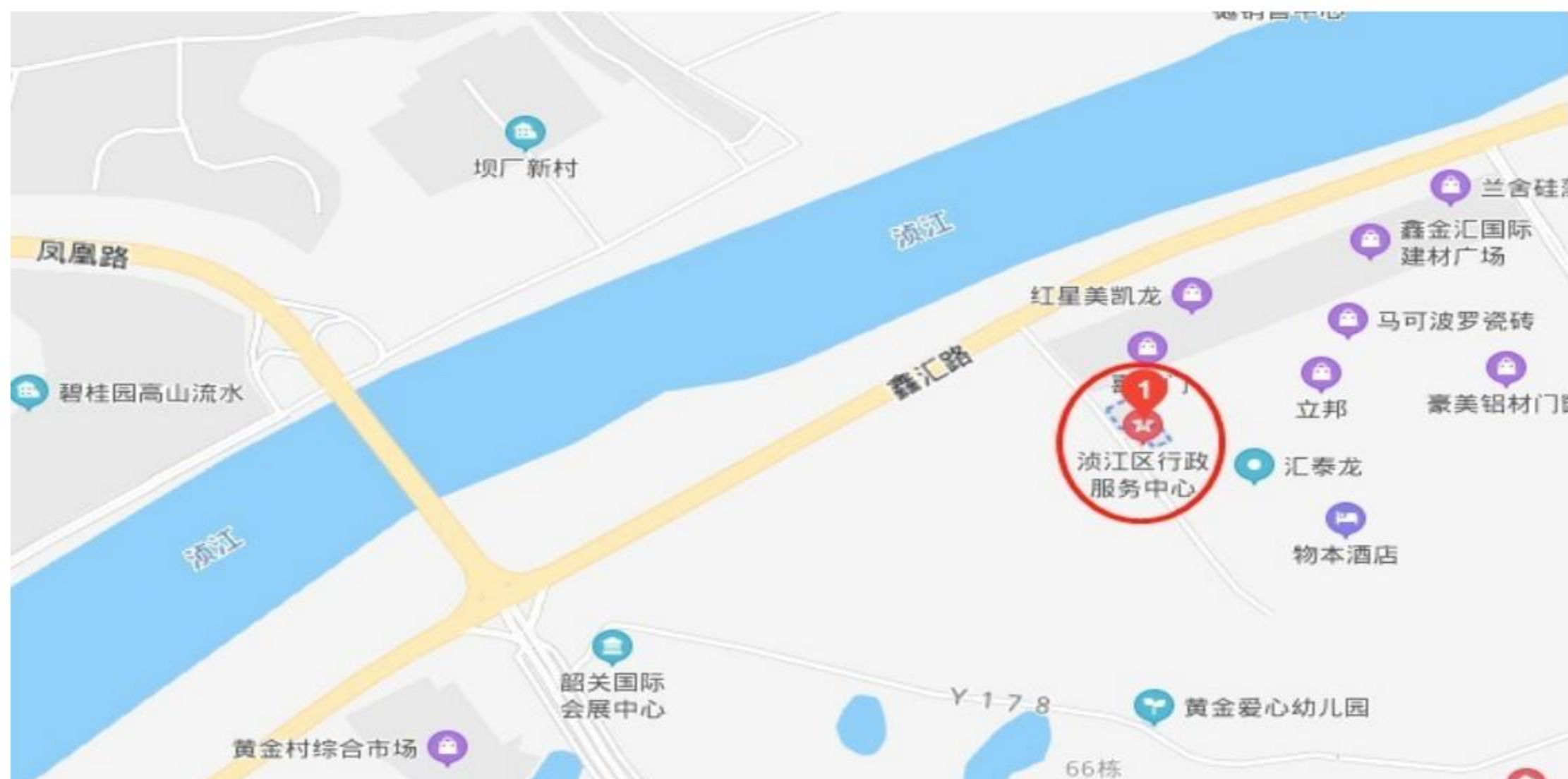
浚江区政务中心一楼办公指引图