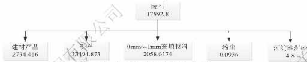
图 4 硫元素平衡图 (t/a)