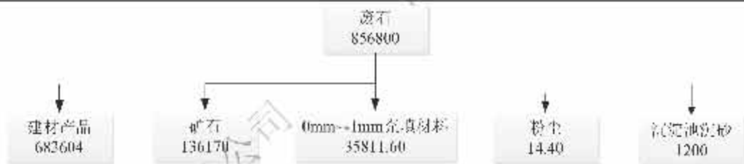
图 1 总物料平衡图 (t/a)