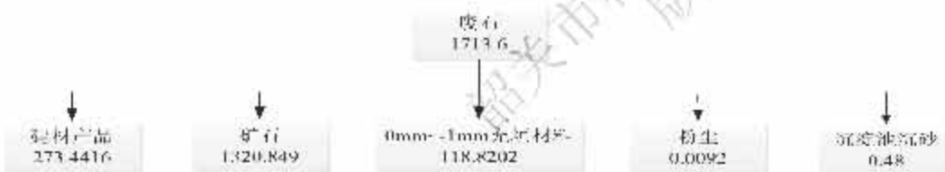
图 3 铅元素平衡图 (t/a)