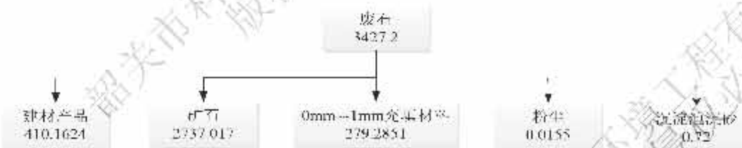
图 2 锌元素平衡图 (t/a)