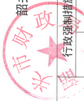
韶关市财政局 2018 年度行政强制实施情况统计表